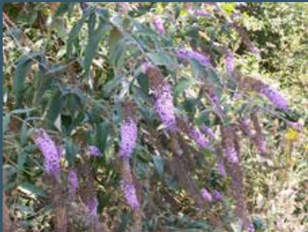
Buddleja davidii