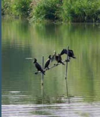
Grand cormoran (Phalacrocorax carbo), étang de Croissy-Beaubourg.